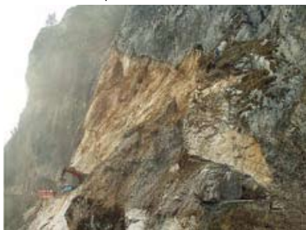
Vista da nord dopo la volata

di importanti strutture da subverticali a mediamente inclinate allineate in senso NNW-SSE lungo le quali si riconoscono evidenti macro e meso-indicatori cinematici di trans-tensione che delimitano fasce cataclastiche piuttosto imponenti per estensione. Nel complesso tali strutture sono state attribuite a piani di taglio cui si correlano iniziali linee transpressive, e solo successivamente riattivate dalla fase distensiva, che comprendono lateralmente la piega trascinata che caratterizza il versante roccioso sovrastante la loc. Moline. Tali strutture si presentano nell'ammasso con spaziatura variabile tra un minimo di 50cm ed un massimo di 3m circa venendo a costituire un'ampia zona di plasticizzazione dell'ammasso roccioso ordinata per fasce subverticali a sviluppo ondulato.