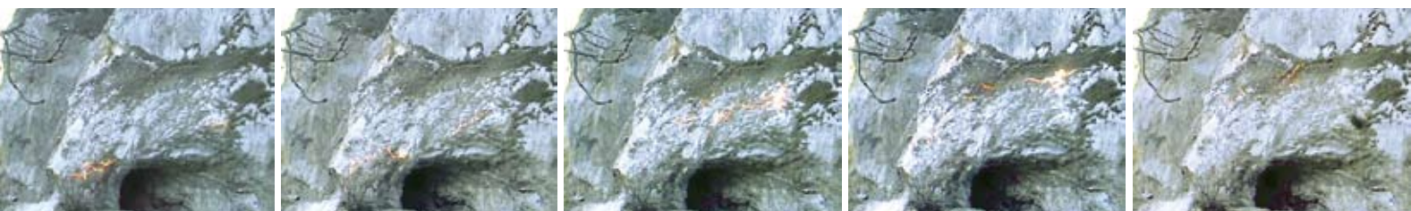
La sequenza dell'abbattimento con esplosivo

Al fine di salvaguardare il piano viabile è stata individuata, come intervento di mitigazione dei probabili effetti, la preservazione della spalla esterna della galleria, con funzione di argine naturale. L'argine di roccia inoltre avrebbe potuto favorire un migliore trattenimento del materiale abbattuto sulla sede stradale. La riduzione delle proiezioni di frammenti rocciosi verso valle è stata definita anche attraverso il dimensionamento