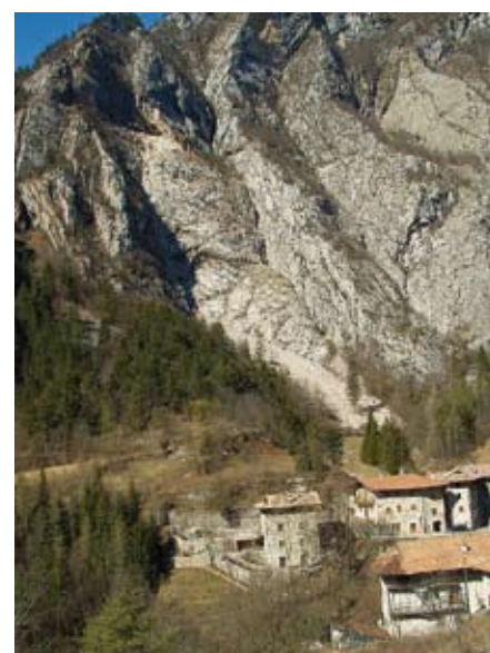
Vista sul versante in primo piano si vedono le case della frazione in secondo piano sul versante si vede la galleria prima della volata

Sulla base dei riscontri e delle stringenti condizioni al contorno venne pertanto individuata come migliore soluzione di intervento l'abbattimento dell'intera porzione rocciosa entro la quale era ricavata