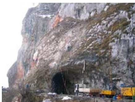
Vista da nord in fase di perforazione