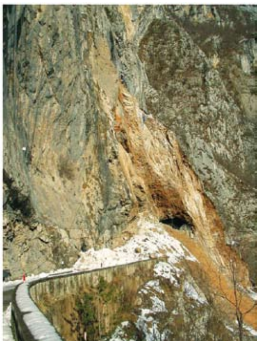
Vista da sud prima della volata