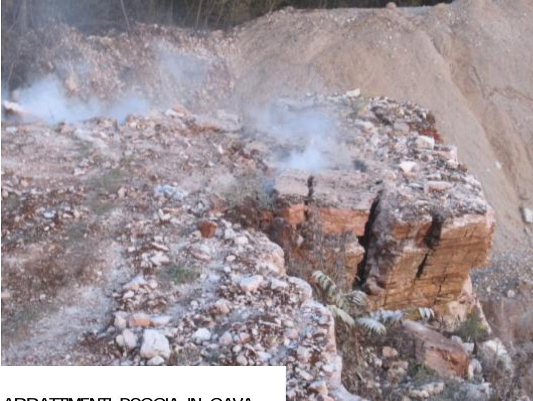
ABBATTIMENTI ROCCIA IN CAVA