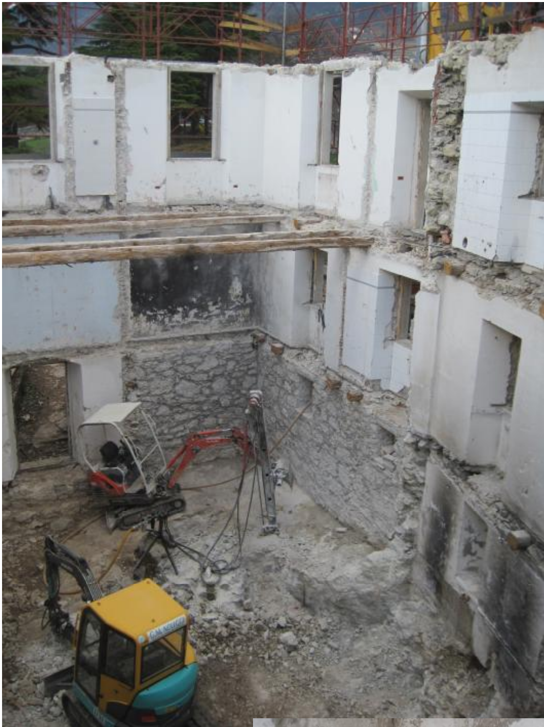
RIMOZIONE ROCCIA A TRENTO Intervento di rimozione roccia all'interno di un edificio storico