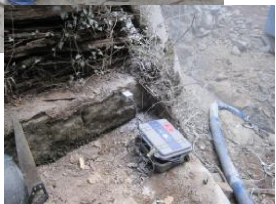
RIMOZIONE ROCCIA A MERANO Intervento di rimozione roccia in contesto inaccessibile a mezzi meccanici di grosse dimensioni