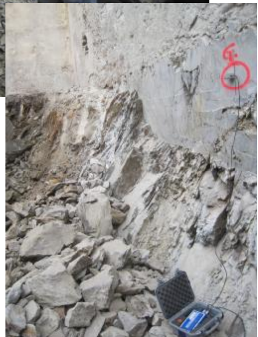
RIMOZIONE ROCCIA A MERANO Intervento di rimozione roccia alla base di un edificio del centro storico.