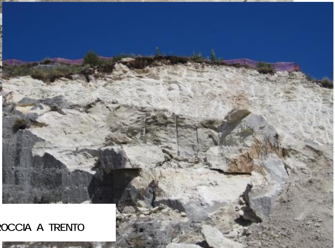
RIMOZIONE ROCCIA A TRENTO