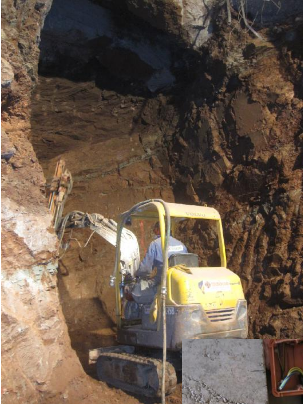
RIMOZIONE ROCCIA A ORTISEI (BZ) Intervento di rimozione roccia al di sotto di un edificio recentemente ristrutturato al fine di realizzare nuovo ascensore per l'accesso ai garage interrati