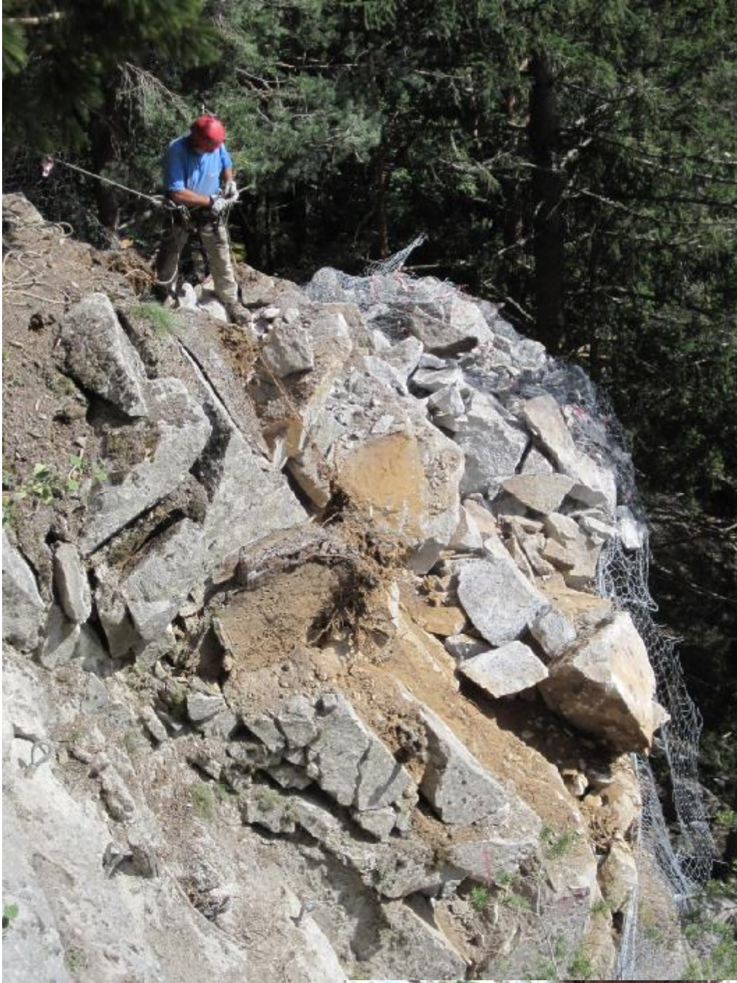
DISGAGGIO SULLA S.P.149 LOC. MARANZA (BZ) Rimozione di circa 100 mc di roccia.